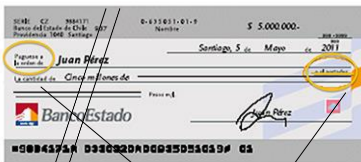
Nominativo y Cruzado